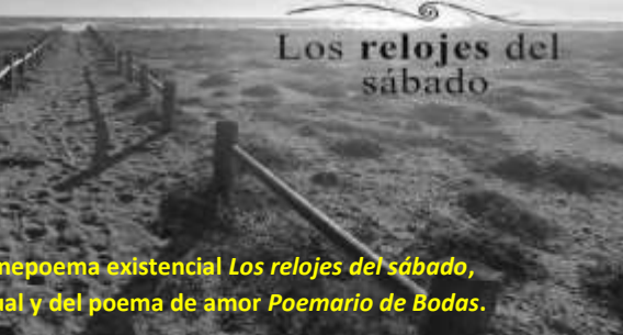
Izquierda: Fotograma del Cinepoema existencial Los relojes del sábado , Derecha: Fotograma del ritual y del poema de amor Poemario de Bodas .