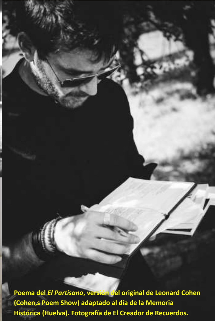
Poema del El Partisano , versión del original de Leonard Cohen (Cohen, s Poem Show) adaptado al día de la Memoria Histórica (Huelva).